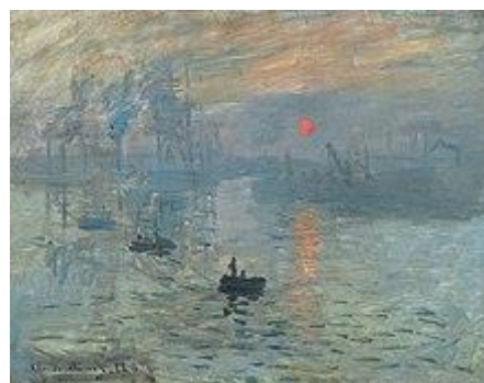
Impression, soleil levant , 1872, ελαιογραφία 48 x 63 εκ - Μουσείο Marmottan, Παρίσι

Γεννήθηκε στο _____, το _____. Ο πατέρας του, ήταν εύπορος έμπορος της εποχής, που διακινούσε προμήθειες πλοίων. Το 1845 , η οικογένειά του μετακόμισε στη _____, που αποτελούσε σημαντικό λιμάνι στις όχθες του _____.